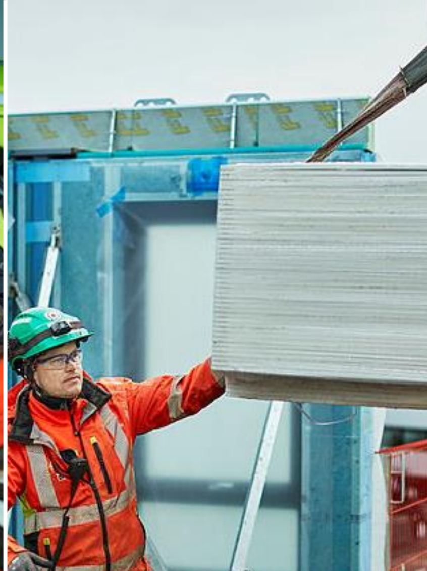
Logistik och materialflöde