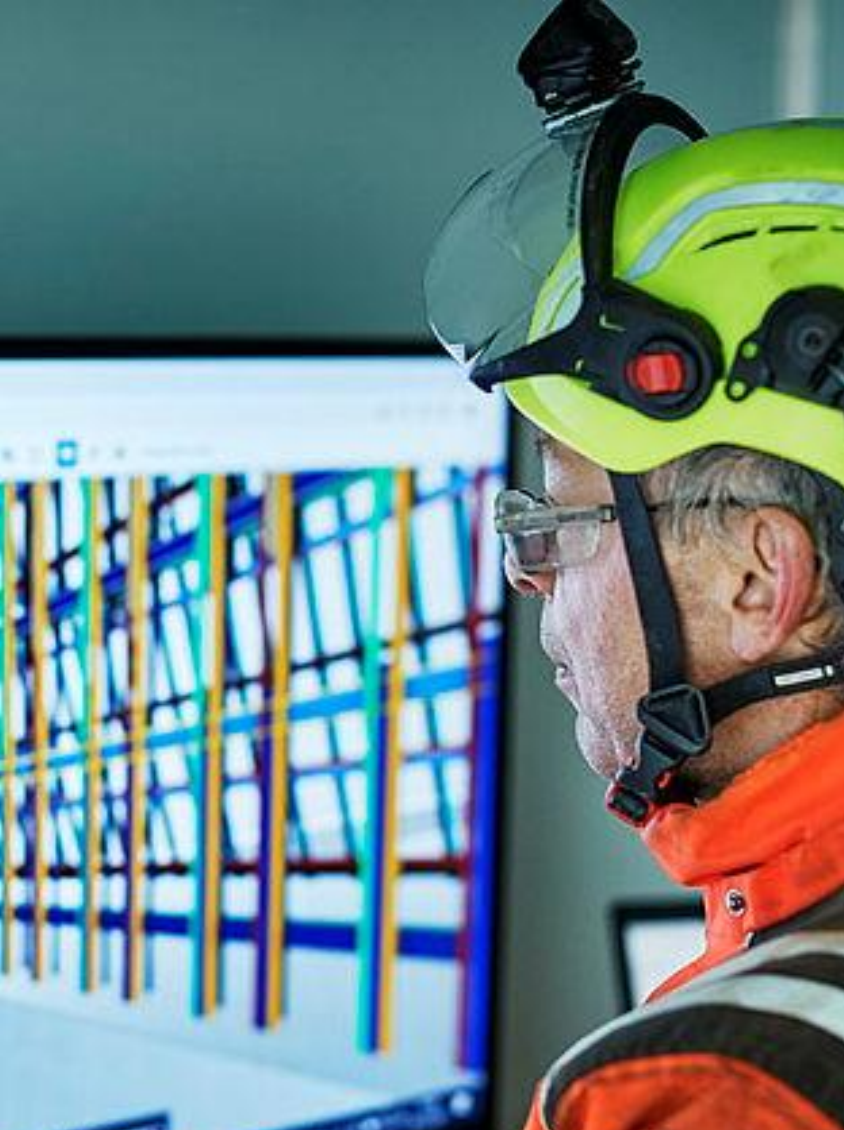
Digitalisering och data